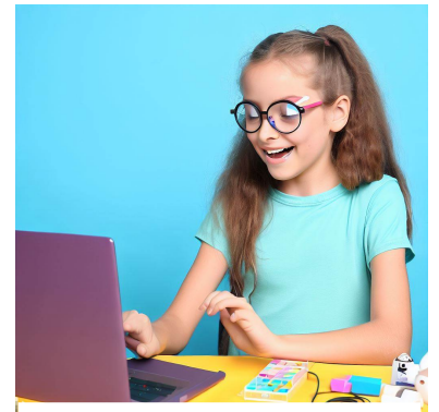
「中学生でもできる！Scratchでゲームを作ろう」という記事に向いている楽しい画像

以上のようなタイトルが考えられます。中学生が興味を持ちそうなテーマを取り上げることで、フリーペーパーがより魅力的になるかもしれません。ご参考になれば幸いです。