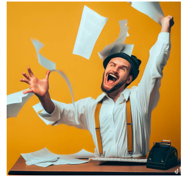
想像力や表現力が発揮された瞬間の楽しい画像

以上のような点から、想像力や表現力を持った人材はIT業界で重宝される傾向にあります。ご参考になれば幸いです。